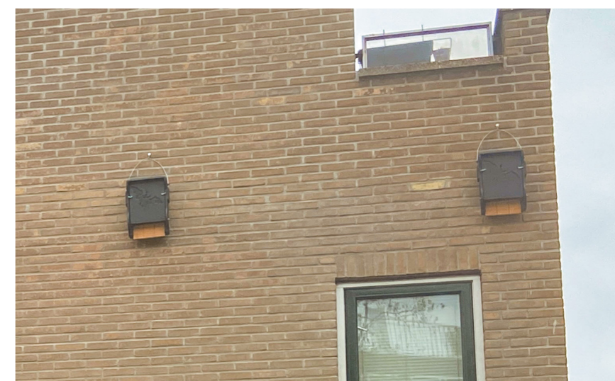
Vlemuiskasten op de hoek van de Schoonderloostraat.

Wist u dat er altijd een flora- en faunaonderzoek wordt uitgevoerd als er plannen zijn voor werkzaamheden in een gebied of gebouw? Er wordt dan gekeken of er beschermde planten of dieren leven in het gebied waarvoor plannen zijn. Zo werd ontdekt dat er een vlemuis actief is rond de Waaldijk. Net als de bewoners zal ook deze vlemuis moeten verhuizen. In april zijn er daarom speciale vlemuiskasten opgehangen aan gevels in de buurt van de Waaldijk. De vlemuis heeft nu alle tijd om te ontdekken dat er een nieuw plekje voor hem is, voordat hij gestoord wordt door de sloopwerkzaamheden.